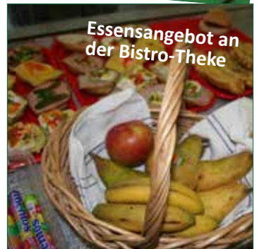
Essensangebot an der Bistro-Theke